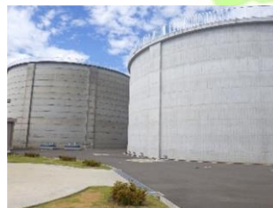
いなりやまはいすいじょう 稲荷山配水場