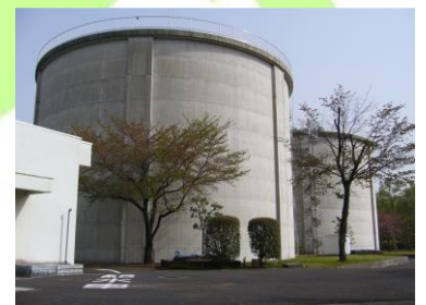
みずのはいすいじょう 水野配水場