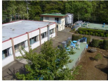
かしわばらじょうすいじょう 柏原浄水場