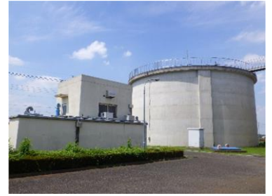
ほりがねじょうすいじょう 堀兼浄水場