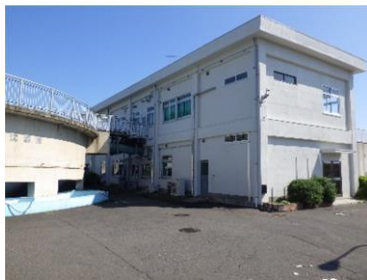
うのきじょうすいじょう 鵜ノ木浄水場