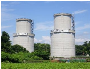
ささいはいすいじょう 笹井配水場