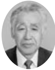
吉沢 永次 議長