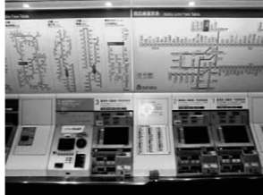
券売機工事も市が3分の2負担

①なぜペデストリアンデッキを造ったか ②横断歩道はなぜ無いのか ③橋上駅は誰が望んだのか ④駅の名前のポードや切符の券売機、ホームの待合室までなぜ狭山市が3分の2負担か ⑤駅への送迎車両の駐車場を駅前につ造れないか ⑥エスカレーターの屋根設置はどう