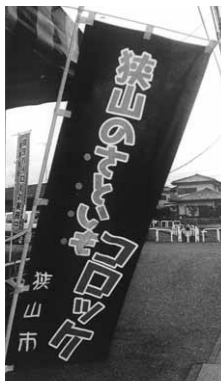
市内肉屋さんの店頭で

市民部長 ①果樹栽培をしたいとの相談が1件あった。農業委員会と連携し、JAいるま野と協力して推進していく。②米や野菜に影響があった。今後、川越農林振興センターやJAいるま野などと連携し消費の拡大を図り、支援対策を協議していきたい。③川越農林振興センターの支援で報道機関に情報提供を行い、県内への浸透を図り、販路の拡大促進を行っている。④庁舎食堂や市内飲食店への働き掛けを行っている。⑤21年12月に、JAいるま野狭山