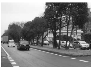
東京狭山線の桜並木

市長 ①24年度末の完成を目指しているが、東京都境と国道463号の立体交差がさらに数年かかる見込みである。②無料化は困難との県の回答であるが、引き続き要望していく。③歩道部分の植栽スペースを設けるよう要望しており、桜の木も移植可能なものは要請していく。④横断場所の限定、信号時間間の延長などの対策を県に要望してい