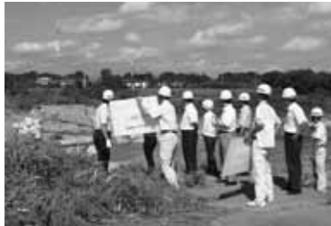
上奥富堰の被害状況を視察

工事は、渇水期の11月に着手し3月末までを予定。流れを変えないと着工が難しいので、最良の方法で実施する。左岸の自治会などには、工事内容を周知する。