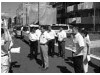
新狭山地内の路線認定箇所を視察

九頭竜池の水を花菖蒲園に引き込むなどの対策は、膨大なお金がかかると思う。また、井戸は規制があるため検討していかねばいけないと考える。来年は咲かせるよう、努力していく。