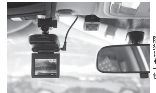
交通安全や地域の防犯にも一役

総務部長 近隣西部地区10市の状況は、全車両に設置済みが1市、一部導入済みが3市、導入予定市が1市となっている。今後、各市の導入後の状況、ドライブレコーダーのデータ管理や運用方法について調査検討していく。