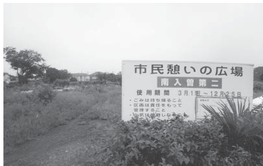
利用率は100%、人気の市民農園

環境経済部長 市民農園は、昭和50年から健康な体と豊かな心を養う、培う場を提供することを目的に勤労者憩いの広場として設置して