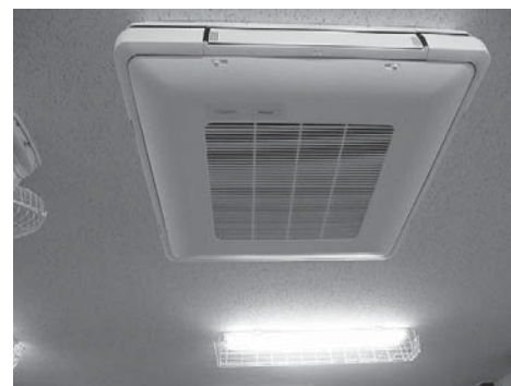
園児のためにクーラーの設置を

猛暑から幼稚園児を守るため、全ての公立幼稚園にクーラーの早急な設置を。27年度以降も存続する入間川・水富幼稚園には冷暖房設備を。予定はどうなっているのか。