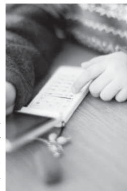
あなたのお子さんは大丈夫ですか

学校教育部長 市内の携帯電話やスマートフォンを持つ小学生の25%、中学生の55%が何らかのトラブルを経験しているという結果がある。ネット上のトラブルは重大事件に発展する恐れがあり、各校に情報モラル教育の実施と、道徳教育や