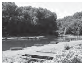
前山の池は11月15日オープン 料金は1日1,800円(半日1,000円)

開設するに至った経緯は。 A 民間施設であった釣場の用地取得が26年度末に完了し、利用方法を検討した結果、既存施設の効率的な活用を図ることが現時点では適切であると判断し、へらぶな釣場を開設することにしたもの。