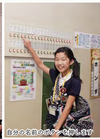
自分の名前のボタンを押します