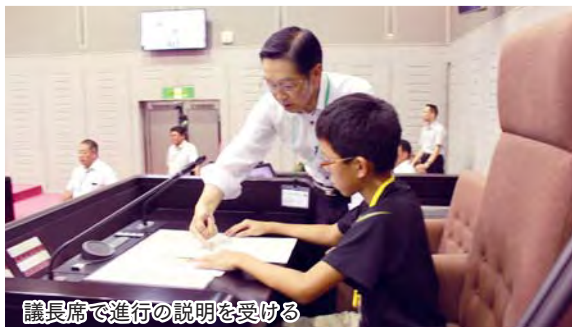
議長席で進行の説明を受ける