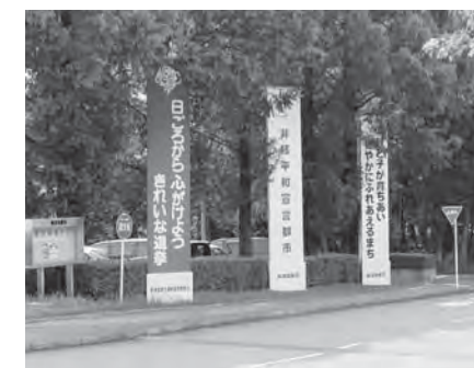
那須塩原市の「平和宣言の塔」(中央)

市民の保管する資料は、編集の必要、所有者の同意、さらには個人情報への配慮などが求められるので、これらを検証する中で活用を検討したいと考えている。