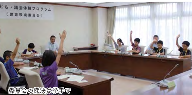
委員会の採決は挙手で