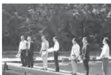
園内の釣場を視察

◆稲荷山環境センターの更新 を見据え財源の確保を 建設環境委員会 Q 稲荷山環境センターは、現在、長寿命化計画を実施しているが、更新の見解は。 A 新たな焼却施設の更新は、現在策定中の第4次総合計画前期基本計画で示すこととし、実施計画を策定する中で、財源の確保に向けた庁内の合意を考えている。