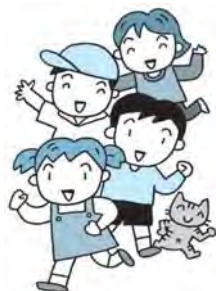
子育てしやすい狭山市に

③今後、若い世代を呼び込むためにも、本市の充実した子育て支援施策を積極的に発信することは重要と考えている。子育てするなら狭山、と思っていただけるよう、市ホームページを見直し、見やすく充実した情報の提供に努めていきたい。