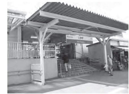
現在の入曾駅前(東口)

のだろうと思っている。ある部分では我慢してもらうことも必要であると思う。財源も検討しないといけない。実現可能な案を、地域のかたがた、地権者のかたがた、また市議会にも理解いただく中で、方向性を早急に示していくことが私の役目であると考えている。