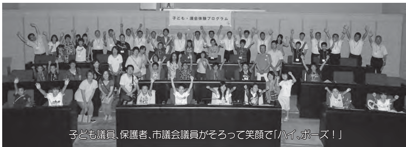
子ども議員、保護者、市議会議員がそろって笑顔で「ハイ、ポーズ！」