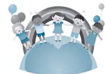
"With all people For all people"

選挙管理委員長 直接の連携ではないが、同カレッジで制作した有権者ノートを新成人に郵送し、啓発を図っている。若い世代に向けて SNS を利用し、選挙情報の提供や投票の呼びかけなどを実施していることから、今後はこの分野で選挙カレッジとの連携に努めていきたい。