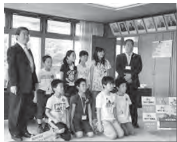
正副議長室で記念撮影

昨年につき、市内の公立小学校の5・6年生を対象に「子ども・議会体験プログラム」が7月23日(木)に行われ、23名の小学生が市議会議員になり市議会を体験しました。夏休み中にもかかわらず、市政に興味・関心を持った次代を担う子どもたちが集まり、委員会室で行う常任委員会と議場で行う本会議を体験しました。