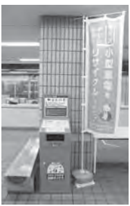
市役所設置の回収ボックス

◆環境 ◆小型家電回収ボックスの成果は。 A 市内10カ所の公共施設に回収ボックスを設置し430キを回収。26年度の小型家電総回収量は約190キあり、廃棄物の減量と循環型社会の構築へ一歩前進したと考える。