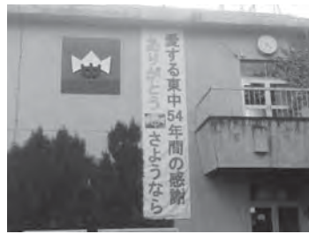
東中学校にある懸垂幕

総合政策部長 地方公共団体の統一的な基準による財務書類などの作成を目的とし、固定資産台帳整備の手引きや財務処理に必要な仕訳の考え方などを示したものを。市で台帳の整備を進めているが、総務省は、29年度までに統一基準による財務書類の作成を求めており、台帳整備後の28年度から新システムを導入し、28年度決算による試行検証、29年度には統一的な基準による財務書類の作成に移行する考え。