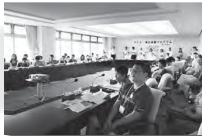
市議会の役割などの説明を受ける

まずは、市議会の仕組みを学びます。その後、議長や常任委員長を決めました。委員会と本会議が始まる前に、議長室、事務局、議員控室、図書室、本会議場を見学しました。