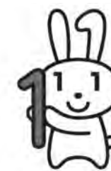
マイナンバー広報用ロゴマーク 愛称:マイナちゃん

市民部長 DVの被害者などで住所地とは別のところに居住しているかた、単身世帯で入院、入所しているかた、また震災の被災者で避難しているかたなどは、9月25日までに、送付してほしい住所を住所地の市区町村へ登録申請すると、その住所に通知カードが送付される。