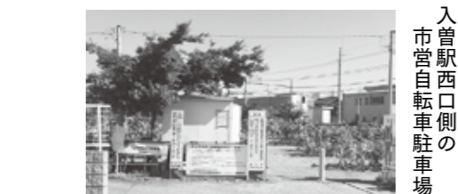
入 市 営 自 転 車 駐 車 場

その他のテーマ▶学童保育の状況、待機児童対策▶中学生学習支援事業「さやまっ子・茶レンジスクール」