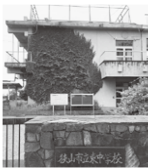
ツタまみれの東中校舎正面

市内のある企業の工場を、東中学校跡地に移転させること“ありき”で「東中学校跡地の利活用に向けた基本的な考え方」がつくられたとは考えたくはないが、市長の見解は。