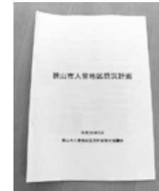
狭山市入曽地区防災計画の他に、不老川流域防災マップも作成した

危機管理監 平成28年の台風第9号などによる災害の経験を活かして、災害が発生した際は、地域の人命や財産は自分たちで守るという共助の考えのもと、自発的な防災活動を内容とする計画を作成したことは、地域の防災力の向上につながる取り組みとして大きな成果である。