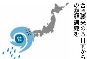
台風襲来の5日前から避難訓練を

ここに掲載していない一般質問の概要は、ホームページでご覧いただけます。ホームページをご確認ください。FAXが郵送でお届けしますので、議会事務局にご連絡ください。04-2953-1111内線3313