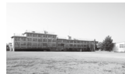
再編による入間中学校跡地利活用

総合政策部長 ①日常の市民生活に不可欠な施設は歩いて行ける範囲に必要な生活施設を集約するコンパクトシティの考え方に沿って整備していくことも必要であることは認識している。公共施設等総合管理計画でも、小中学校を核に、地域施設の機能を複合化した地域拠点施設の整備を公共施設の再編の手法の1つとして示した。②施設によって対象とするエリアや設置の目的が異なることから、統合・再編に当たっては個々の施設の機能を踏まえた上で、機能の集約化や複合化などにより相乗効果が発揮できるよう検討していく。