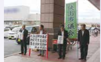
市内3か所で募金活動

9月27日(木)、市内商業施設の店頭をお借りして、北海道胆振東部地震で被害に遭われた方々への災害義援金の募金活動を行いました。