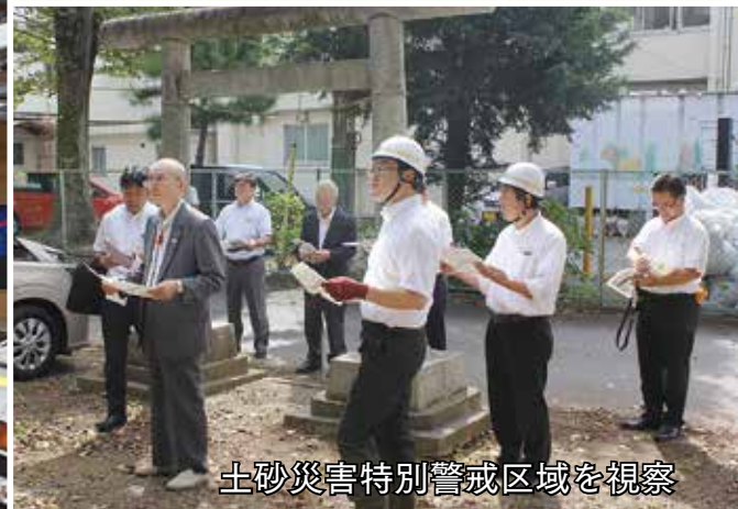
土砂災害特別警戒区域を視察