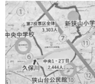
中央地区の投票率低下を危惧する

計画であり、31年度の各選挙期間中に、同体育館の使用が可能な場合には、これまでと同様に投票所とするのか。 選挙管理委員長 ①投票率は、各候補者が掲げる政策や、選挙の種類、投票日の天気など、さまざまな要因が影響するものと考えられる。投票所の変更が投票率にどのように影響するか、端的には言えない。 ②これらの施設も、新たな投票所として検討したが、投票スペースの確保が難しいことや敷地内に急な傾斜があることなどから、投票所としての使用は難しいとの結論に至った。 ③31年4月から8月にかけて、5種類の選挙が予定されているが、旧東中学校の体育館は、30年度秋から解体工事の設計業務を開始するため、建物について所要の調査が行われる。こうしたことから31年4月から8月の選挙で、投票所として使用することはできない。