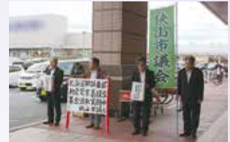
市内3か所で募金活動

9月27日(木)、市内商業施設の店頭をお借りして、北海道胆振東部地震で被害に遭われた方々への災害義援金の募金活動を行いました。