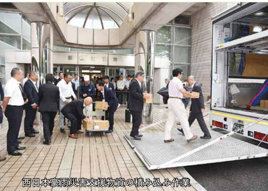
西日本豪雨災害支援物資の積み込み作業