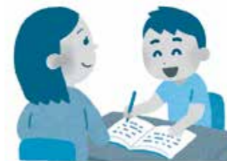
通級指導教室は 個別指導が中心

学校教育部長 例えば情緒障害の児童生徒は、支援指導により相手や場に応じたコミュニケーションや気持ちを落ち着ける手段を学び、望ましい人間関係を築くことができるようになってきている。通級指導教員と通常学級担任、保護者が連携をとりながら、児童生徒のよりよい成