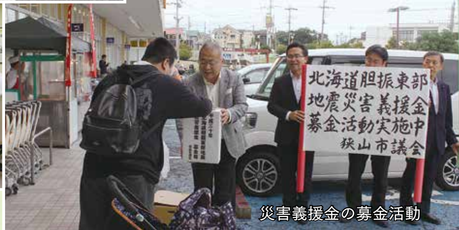
災害義援金の募金活動