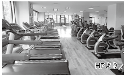
サピオ稲荷山の トレーニングルーム HPより

長寿健康部長 健康増進施設として機能を存続させることを最優先として、現行のサービス水準を低下させないような条件設定が必要である