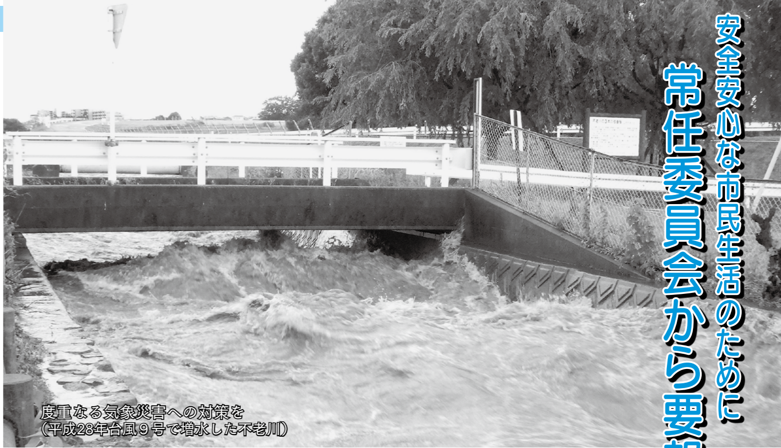
度重なる気象災害への対策を (平成28年台風9号で増水した不老川)

Q 法令の改正の背景は。 A 障害者が65歳以上になっても、通い入れた事業所でサービスを利用しやすくすること、また、福祉に携わる人材に限りがある中で、その人材をうまく活用しながら適切なサービス提供を行うことなどを目的として、介護保険と障害者福祉制度に共生型サービスが創設された。