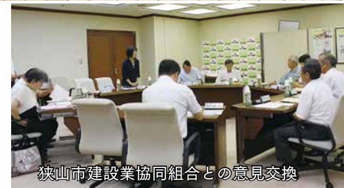
狭山市建設業協同組合との意見交換