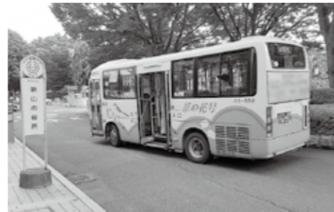
茶の花号の市役所停車がなくなる

③地域公共交通会議で、狭山市駅入口交差点から狭山市役所までの区間の廃止について、意見があったことから、2か月間、乗降客数調査を実施した。市役所での降車人数は、1日当たり0.39人、乗車人数は1日当たり1.07人であった。乗降客数が極めて少ないことから、地域公共交通会議で廃止することが合意された。