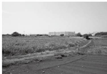
狭山工業団地拡張地区

市長 企業が抱える課題は、従業員の確保や、事業用地の確保などが課題であると認識している。従業員を確保するために、企業支援のPR冊子を作成したところ、平成29年度には掲載された企業では市内の高校から20名の採用を行ったとのこ