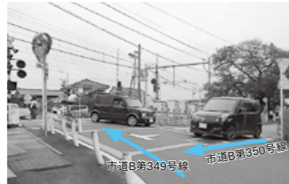
入曽駅南側の交差点と踏切の拡幅を

都市建設部長 市道B第350号線から入曽駅南側の踏切を越えての市道B第349号線の整備については、入曽地区のまちづくりを進めるうえから鉄道事業者などとも協議しながら検討していく。