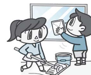
清掃中にも事故の危険が!

①危険箇所の洗い出しは。 ②けがや事故の未然防止の取り組みは。 学校教育部長 ①各小中学校では、教職員が月に一度、チェックシートを活用して安全点検を実施している。その際には、児童生徒の学校生活における動線や児童生徒の学校施設における行動