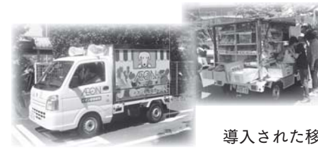
導入された移動販売の車両

昨年12月に茶の花号は入曽コースとして武蔵藤沢駅へ接続されたが、これに加え入曽駅と武蔵藤沢駅の区間の通勤通学コースがあれば利便性が向上すると思うが、市の見解は。 市民部長 入曽駅と武蔵藤沢駅の区間の通勤通学コースの新設については、本年度実施する利用動向調査の結果などを踏まえて、その必要性を地域公共交通会議のなかで協議していく。