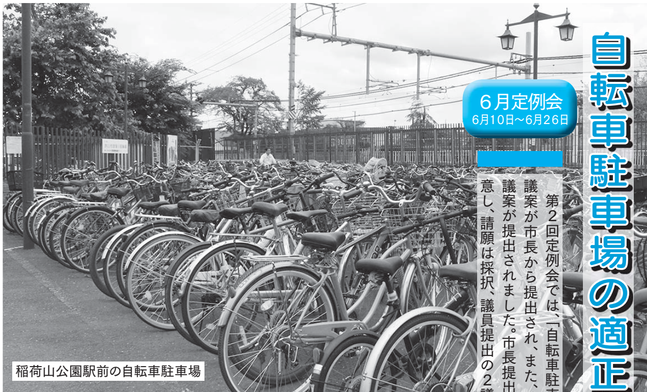
稲荷山公園駅前の自転車駐車場

第2回定例会では、「自転車駐車場条例の一部改正」など、12議案が市長から提出され、また、請願が1件、議員提出議案2議案が提出されました。市長提出議案は原案のとおり可決・同意し、請願は採択、議員提出の2議案は否決しました。