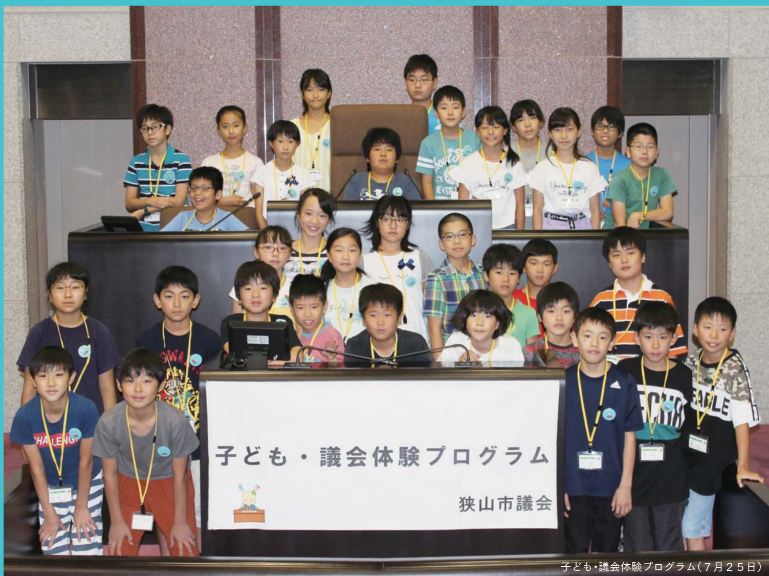
子ども・議会体験プログラム(7月25日)