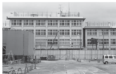
新たな入曽の施設は 市民と共に

市民部長 ①カフェコーナーや図書コーナーのほか、旧入間小学校・旧入間中学校のメモリアル