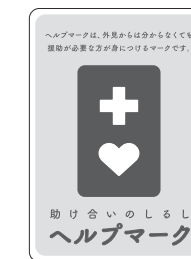
ご存知ですか？ ヘルプマーク

福祉こども部長 地域包括支援センターに啓発チラシを配置するほか、広報紙への掲載や庁舎1階ロビーにあるコミュニティビジョンでお知らせしている。また、各公共交通機関には、周知の協力依頼を行っている。