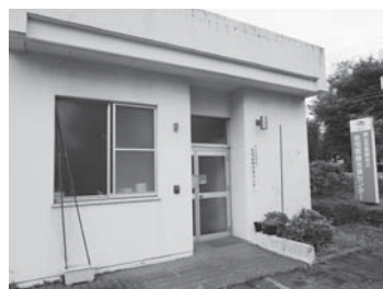
在宅医療のご相談は センターへ

福祉こども部長 障害のある方の婚姻件数は把握していない。相談支援事業所に結婚後の生活に対する経済的な不安や、妊娠・出産及び出産後の育児に関する不安などについての相談が寄せ