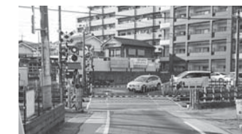
踏み切りは広げることができない

市民部長 安全な歩行者空間を確保する目的で整備し、人が安心して歩行できる空間となっている。にぎわいを創出する場でもあり、人の回遊もさらに活発になると見込まれることを踏まえ、市民広場を自転車に乗車したまま通行できるようにすることは難しいものとする。