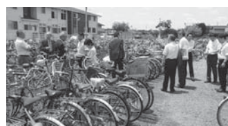
自転車駐車を視察