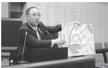
一般質問のイメージ