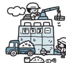
企業誘致で地域経済の活性化

都市建設部長 圏央道狭山日高インターチェンジの近傍に位置する狭山工業団地の東西に隣接する東側の柏原鳥之上地区と西側の上広瀬西久保地区であり、新規に企業を誘致するための部分は柏原鳥之上地区が約7.2ヘクタール、上広瀬西久保地区が約6.2ヘクタールの合計約13.4ヘクタールである。