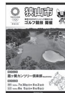
狭山市はゴルフ競技の会場市!

市長 ③オリンピックが本市で開催されることは、市に活力を生み出す千載一遇の機会と捉えており、オリンピックの持つ力や魅力を最大限に活かし、市民の心に一生に一度の思い出が刻まれ、次世代に実りあるレガシーを残せるよう、オール狭山で大会の成功に向け取り組んでいく。