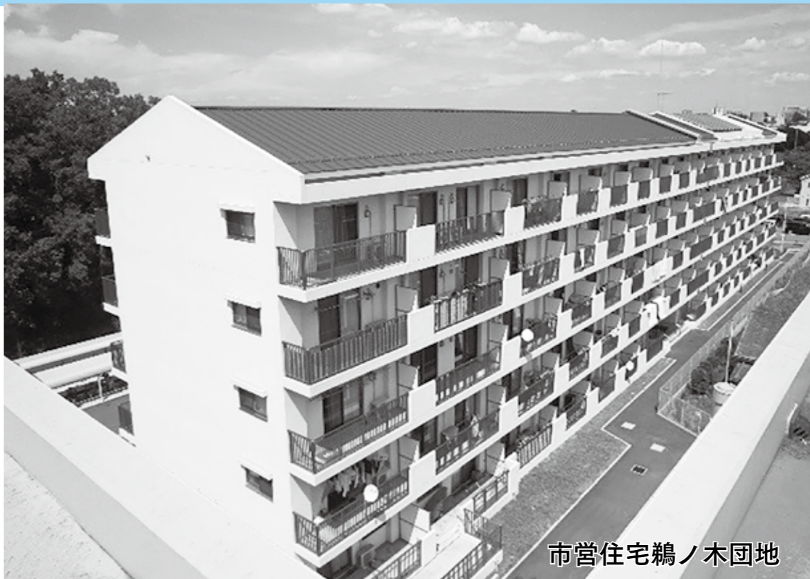
市営住宅鵜ノ木団地