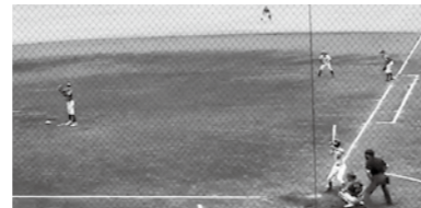
守備につく 狭山市選抜チーム

市長 ②誰もが気軽に継続してスポーツを楽しめる環境づくりを推進するとともに、スポーツ団体と連携し、青少年の競技スポーツの普及と技術の向上を図り、より一層スポーツの振興に資することで市の活性化にもつながるよう全力で取り組んでいく。