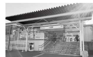
入曽駅東口改札口は 残しての音が

都市建設部長 駅の新築、橋上化と東西自由通路の現在の計画内容が、入曽のまちが抱える根本的