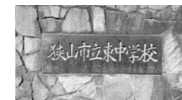
東中の廃校は 本当に正しかったのか