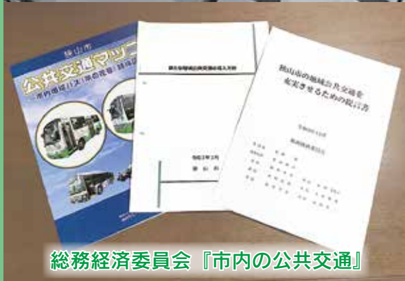
総務経済委員会『市内の公共交通』

駅前広場等の公共施設計画や民間進出企業の計画については、現在のイメージとなりますので、今後の協議により一部変更となる可能性があります。