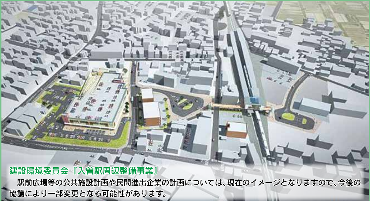
建設環境委員会『入曽駅周辺整備事業』

駅前広場等の公共施設計画や民間進出企業の計画については、現在のイメージとなりますので、今後の協議により一部変更となる可能性があります。