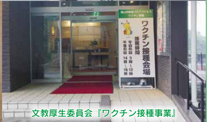
文教厚生委員会『ワクチン接種事業』