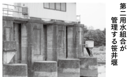
第二用水組合が 管理する笹井堰

環境経済部長 大規模改修などが計画された際には、本市を含め、国や県との協議を経ながら、必要に応じて国や県に要請してまいりたい。