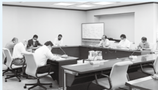
デジタル化推進特別委員会のようす