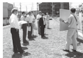
市内視察のようす

建設部門では、入曽駅周辺整備事業について、開発地域の指定、道路や雨水排水などの街の整備、橋上駅舎、商業施設誘致などを調査・研究してまいります。 環境部門では、CO 2 削減に向けた取り組みや、外来生物の駆除と在来種の保護、緑化の推進や公園整備等を含む第3次狭山市環境基本計画の策定について調査してまいります。