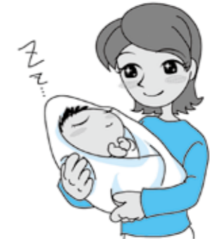
子を持つ希望を叶えたい!

②広く不妊治療の認知が広がることや、経済的負担が軽減されることに加え、治療の標準化と安全性の担保が図られることから、治療を希望する方が増え、子を持つ希望をかなえられる夫婦の増加が期待できる。