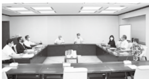
議会運営委員会のような

議会運営委員会は、議員8名で構成され、会期の日程、議会に関する条例・規則に関すること、議会運営に関することなどについて協議を行っています。