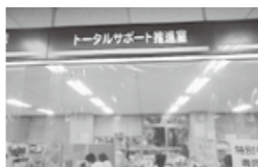
困ったときにはこちらで

②相談支援を行っているトータルサポート推進室職員とひとり親家庭の自立に関する相談を受けていることも支援課の母子・父子自立支援員が連携し、就労支援のほか、生活福祉資金の貸付制度の紹介、フードバンクとの連携による緊急食料支援、失業手当金や傷病手当金の手続支援、年金の受給に関する情報提供などを行っている。なお、令和2年度の実績では142名に対し延べ338回の相談支援を行っている。