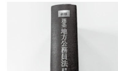
任命権者の責任は

市長 職員の義務違反は、任命権者の責任として厳正に処分する必要があると捉え、地方公務員法に基づき厳格に対処し、お詫び申し上げたところである。