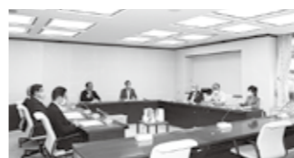
総務経済委員会のような

ハラスメントの防止については、職員を守り、住民の福祉向上のため。新型コロナウイルス対策については、市民の命と暮らしを守るため。市内の公共交通については、昨年度に市への提言を行ったことを踏まえた、暮らしやすさの向上のため。 3つのテーマの進捗について調査・研究をしていく予定です。