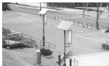
西口市民広場の 再エネ利用の 照明

環境経済部長 地域脱炭素ロードマップ案でも示されており、その中から本市は実現性が高い施策について、現在策定中の第3次狭山市環境基本計画及び狭山市地球温暖化対策実行計画に位置づけていく。