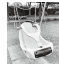
体幹が弱い子も 楽しめるブランコ

学校教育部長 園児、児童が人の多様性に触れながら、共に生きる心を育むことが期待でき、誰もが同じ場所で楽しむことができる意義があるものと捉えている。