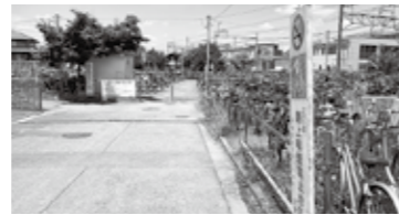
狭山市 第11 自転車 駐車場

市民部長 令和2年度に都市建設部が実施した入曽駅周辺自転車駐車場調査によると、コロナ収束後の利用台数を1,146台と見込み、鉄道事業者が整備する340台分を考慮すると、806台分が不足するという検討結果が示されているが、実際の収容台数や民間駐輪場の利用実態など、現在の状況などを参酌し、代替地における必要収容台数を決定していきたいと考えている。