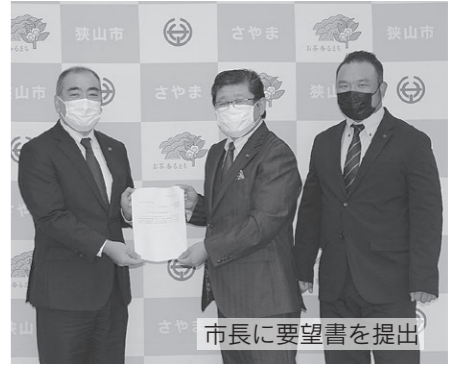
市長に要望書を提出