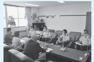
航空自衛隊入間基地での要望活動の様子

基地対策特別委員会では、8月2日に市民の生活環境の改善と基地周辺対策の一層の充実が図られるよう、防衛省北関東防衛局及び航空自衛隊入間基地に赴き要望活動を実施しました。例年は議長に加え、委員全員が参加していましたが、新型コロナウイルス感染症対策のため、議長、正副委員長が代表参加となりました。 ○主な要望と回答の要旨 要望 航空機の安全飛行の徹底 回答 操縦士や整備士などの飛行場関係者に対し、安全教育を行い、高い安全意識を常に保持するよう徹底している。