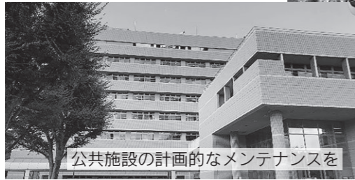
公共施設の計画的なメンテナンスを