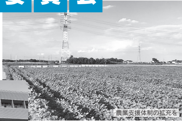
農業支援体制の拡充を