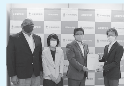
北関東防衛局長(写真右端)に要望書を手渡す議長、正副基地対策特別委員長