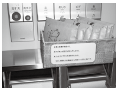
トイレ内生理用品 (大和郡山市)

学校教育部長 ②女性にとって、必要不可欠であるとの認識から、応急的な対応に備えて保健室に常備しているが、学校生活以外においても使用できる生理用品までを学校のトイレに設置することは、現在、教育委員会としては考えていない。 危機管理監 ③生理用品については、約5万1,000枚を備蓄している。今後、入れ替え時期となる生理用品についても、関係課と連携し、有効活用を図っていく。