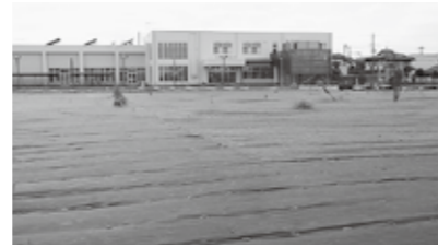
入曽子育て支援拠点施設の予定地

②施設を自らの資金で整備し所有する優先交渉権者が維持管理業務について担うものであり、公募に係る業務要求水準書では、業務範囲を日常の警備や清掃業務とともに、建物・設備などの保守点検や植栽管理、環境衛生、修繕などと位置づけている。