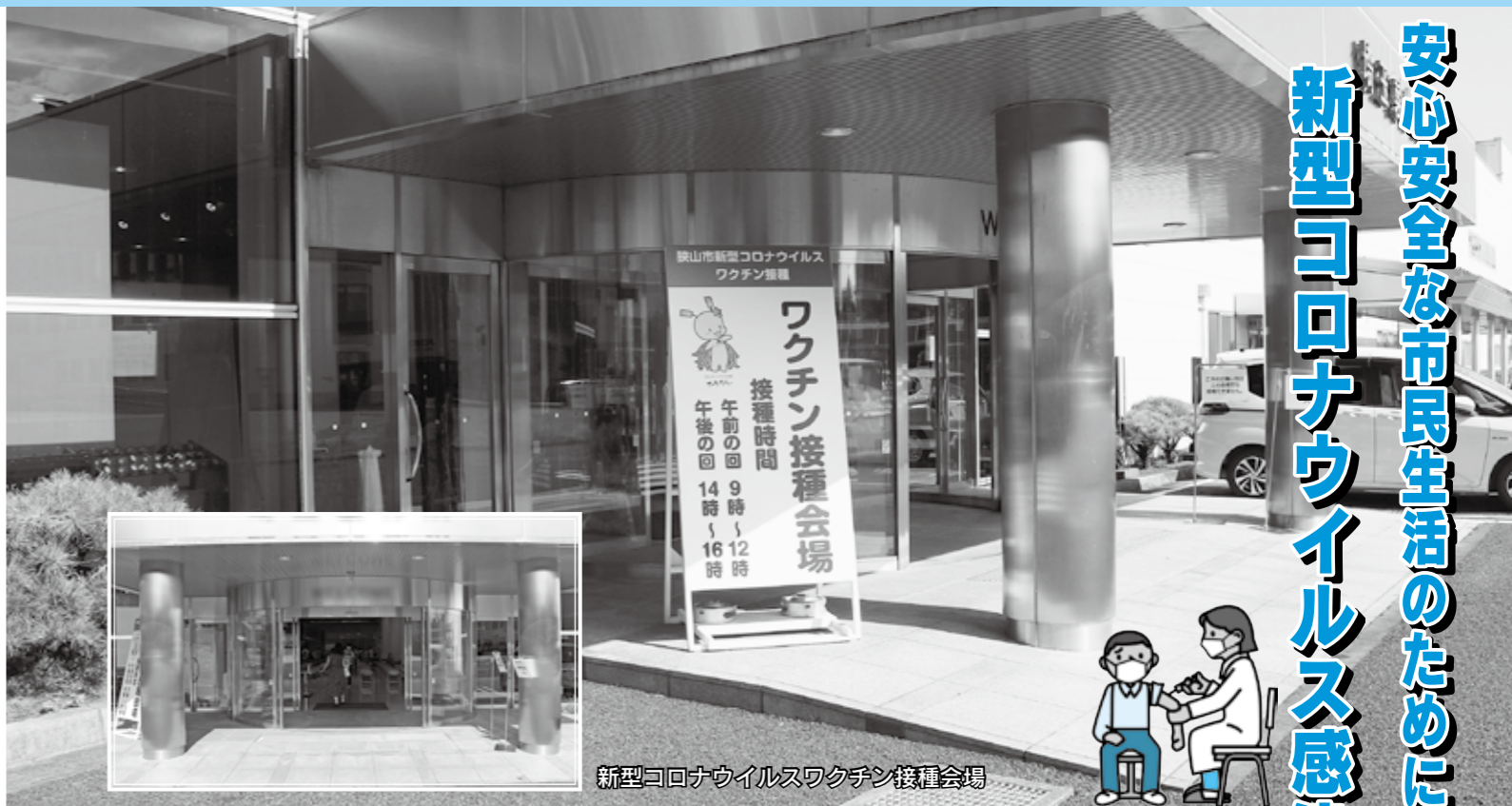
新型コロナウイルスワクチン接種会場