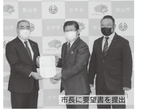
市長に要望書を提出