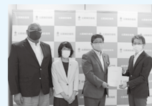
北関東防衛局長(写真右端)に要望書を手渡す議長、正副基地対策特別委員長

要望 航空機騒音の軽減 回答 騒音対策区域上空を飛行し、基地周辺の住民の生活環境に配慮する。また、土日祝日や夜間の用務に係る飛行も必要最小限とするよう努める。 要望 航空機騒音に対する住宅防音工事 回答 所要予算の確保と対象となる世帯への防音工事及び機能復旧工事の早期完了に努める。 要望 基地内の雨水流出抑制対策 回答 雨水調整池の設置や東町地区整備に併せた浸透池の整備を行ってきた。