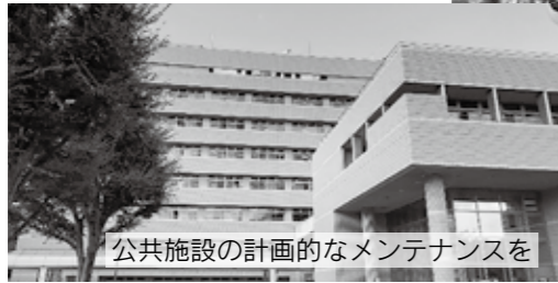
公共施設の計画的なメンテナンスを