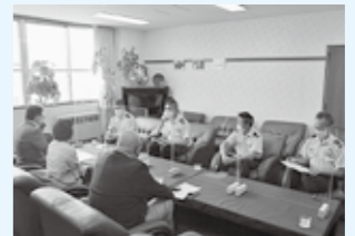
航空自衛隊入間基地での要望活動の様子

基地対策特別委員会では、8月2日に市民の生活環境の改善と基地周辺対策の一層の充実を図られるよう、防衛省北関東防衛局及び航空自衛隊入間基地に赴き要望活動を実施しました。例年は議長に加え、委員全員が参加していましたが、新型コロナウイルス感染症対策のため、議長、正副委員長が代表参加となりました。 ○ 主な要望と回答の要旨 要望 航空機の安全飛行の徹底 回答 操縦士や整備士などの飛行場関係者に対し、安全教育を行い、高い安全意識を常に保持するよう徹底している。