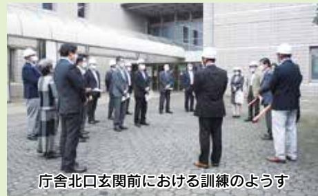
庁舎北口玄関前における訓練のようす

10月19日(火)、議会では、防災力の強化を図るとともに、傍聴者などの安全を確保できる避難体制を構築することを目的とした避難訓練を実施しました。