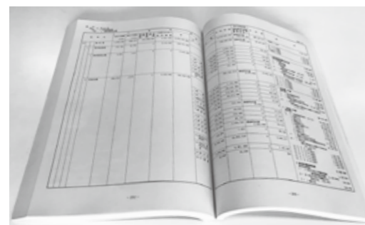
令和2年度一般会計決算認定を慎重に審議

直しの検討の3項目を委員会の要望指摘事項として決定いたしました。今回の「要望指摘事項」の実施状況について、今後も注視してまいります。 市は、気候変動による災害や新型コロナウイルス感染症に伴う経済危機などによって、劇的な環境変化への即時的な対応が求められており、委員会としては、今後も時代の要請に応える市政運営を追求し続けるべく、調査と研鑽を重ねて参ります。