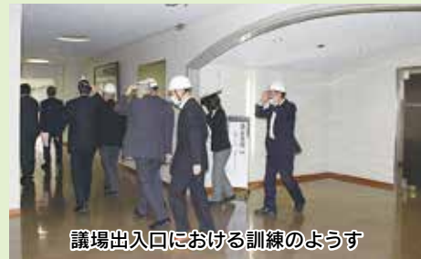
議場出入口における訓練のようす

訓練は、議会開催中に地震が発生し、議場内が停電していることを想定したものであります。訓練開始とともに、全議員が書類などで頭部を守り、避難経路の確認を行いました。また、車椅子利用者を含む傍聴者が安全に避難できるよう取り組みました。