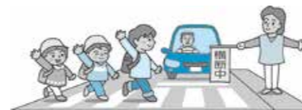
見守り、毎朝ありがとう!

学校教育部長 歩道は段差や凹凸がないか、区画線は外側線、グリーンベルト、横断歩道、一時停止が適切な場所に設置されているか、ガードレールや簡易ポールは適切な場所に設置されているかなどを確認した。また、通学路での交通事故発生箇所の洗い出しやゾーン30などの交通規制が必要な箇所がないか、見通しが悪くな