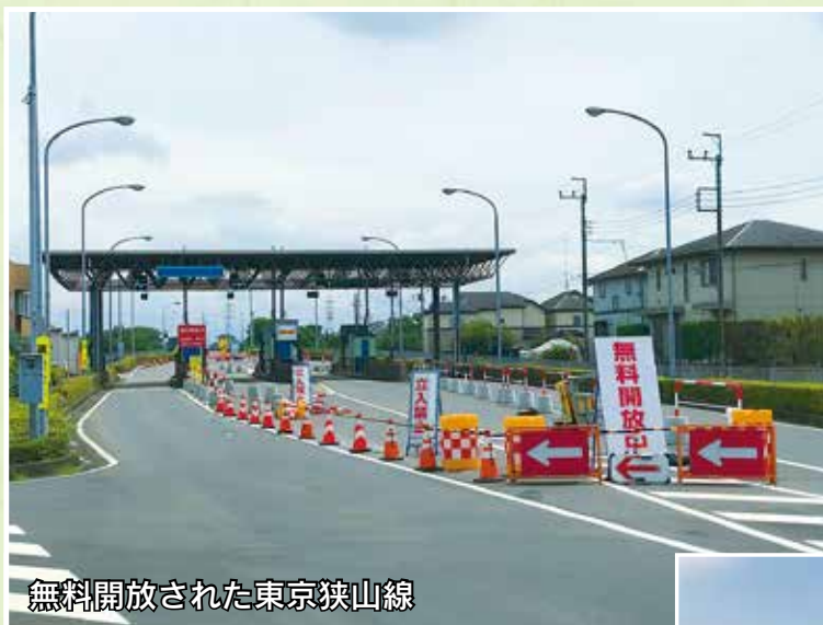
無料開放された東京狭山線