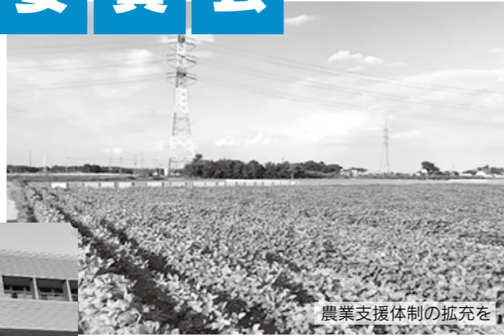
農業支援体制の拡充を