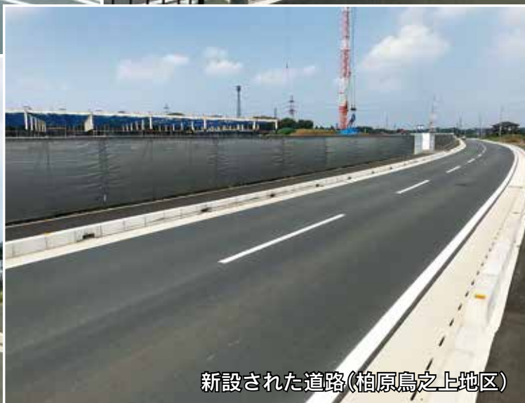
新設された道路(柏原鳥之上地区)