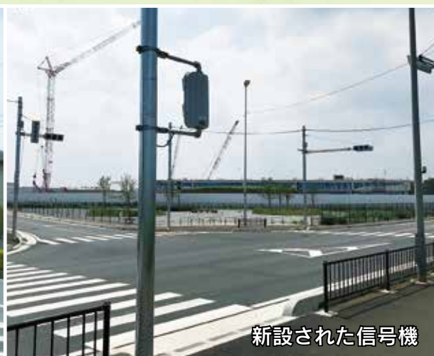
新設された信号機