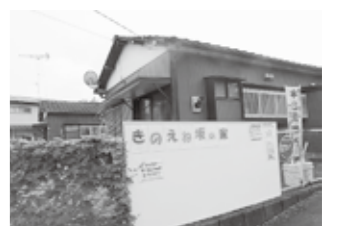
多世代型拠点施設きのえね坂の家

③現在、このような方々が交流できる「多世代型常設拠点」を増やしていくための助成を行っている。重層的支援体制整備事業は、支援者や専門職の負担軽減にもつながることから、今後も、地域にある既存の施設や支援機関との連携強化により身近な地域で相談ができる体制の構築に努めていく。