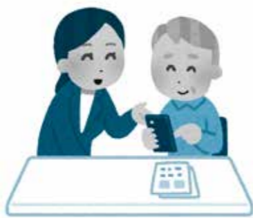
誰も取り残さないデジタル化推進を

令和3年第3回定例会において、総務経済委員会に付託された議案8件について、9月7日、8日及び15日の3日間、慎重な審査を行いました。