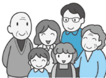
豊かな暮らしの実現のために

◆まちづくりの目標について 『豊かな暮らしを実現すること』を目標に『狭山市版コンパクトな地域づくり』を展開するとしているが、どのように関連するのか。 都市建設部長 狭山市駅周辺を中枢拠点、新狭山駅、入曽駅、稲荷山公園駅周辺を地域拠点として、利便性の向上と交通結節機能の強化を図り、市内8地区の居住地を地域コミュニティとして、各地域の特性に応じた魅力あるまちづくりを進める。さらに各拠点や地域コミュニティなどの地域間の連携を図るために、公共交通ネットワークを形成する都市構造を構築することで、コンパクトな地域づくりと豊かな暮らしが実現できるよう目標として掲げた。