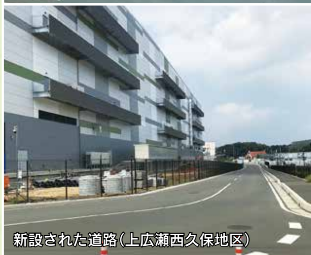
新設された道路(上広瀬西久保地区)