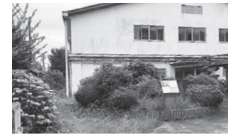
旧第7投票所だった東中体育館

環境経済部長 「東中学校跡地の利活用基本方針(案)」に基づき、鋭意努力し取り組んでいく。