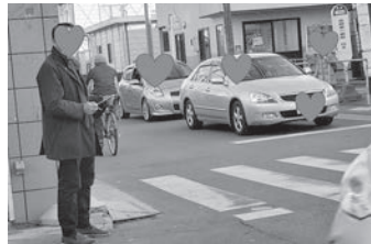
通り抜け車両で混雑する停車場線

これまでも市民から寄せられた相当数の質問にも丁寧な答えており、引き続き事業に対して理解をいただけるよう努力をしてみたい。