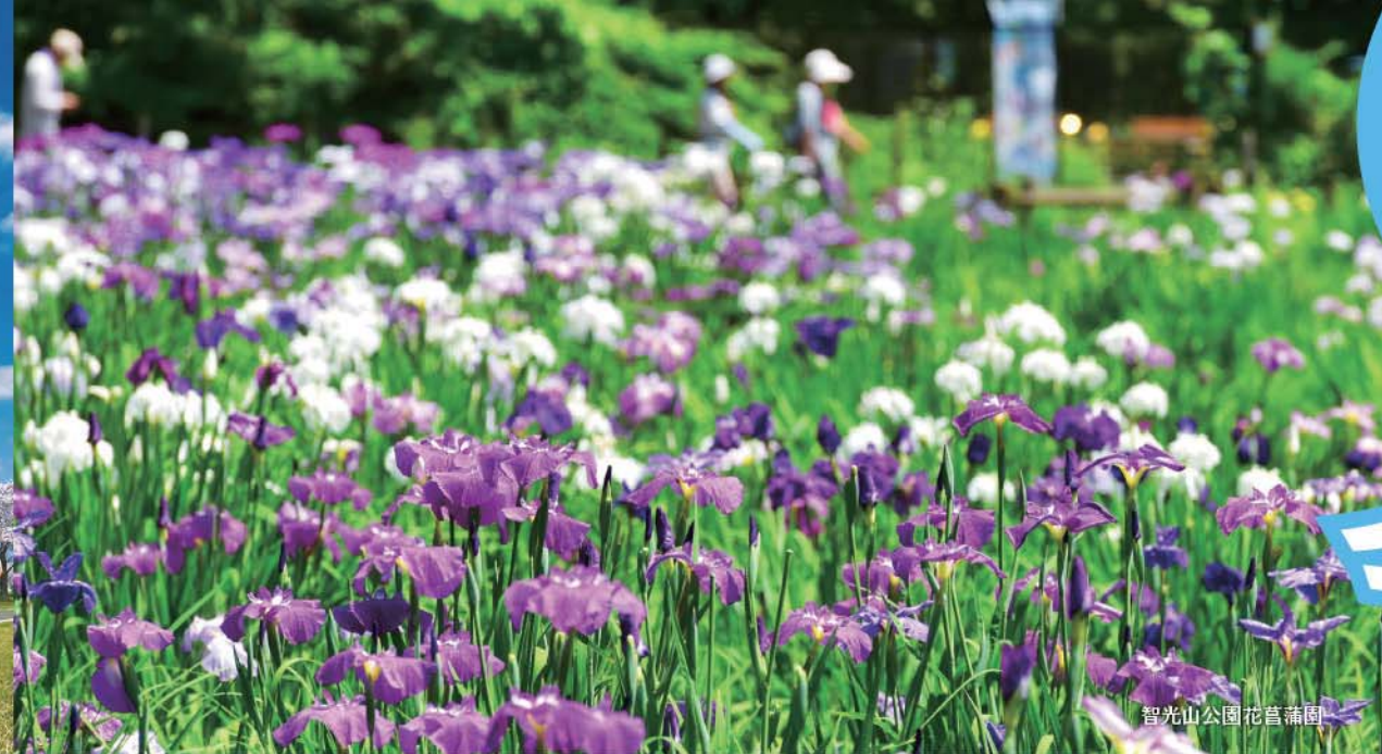
智光山公園花菖蒲園