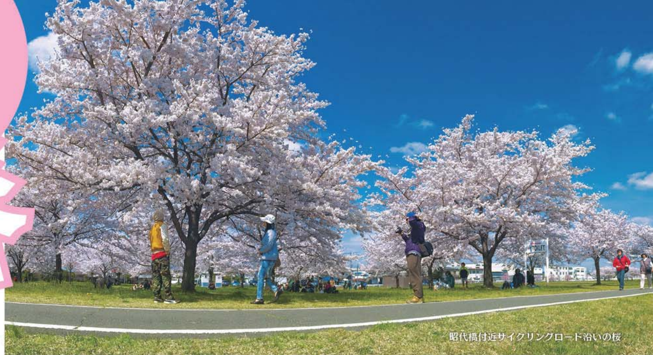
昭代橋付近サイクリングロード沿いの桜