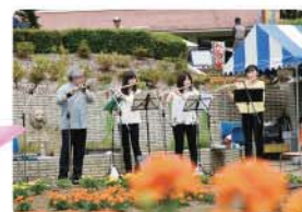
▲春のバラフェスタの様子

交通:狭山市駅西口から西武バス「智光山公園」行き約13分「終点」下車徒歩約15分または「サイボクハム」行き約4分「上宿」下車徒歩約8分 ■場所:P12参照