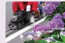
1,000株以上の鮮やかな紫陽花が咲き誇る