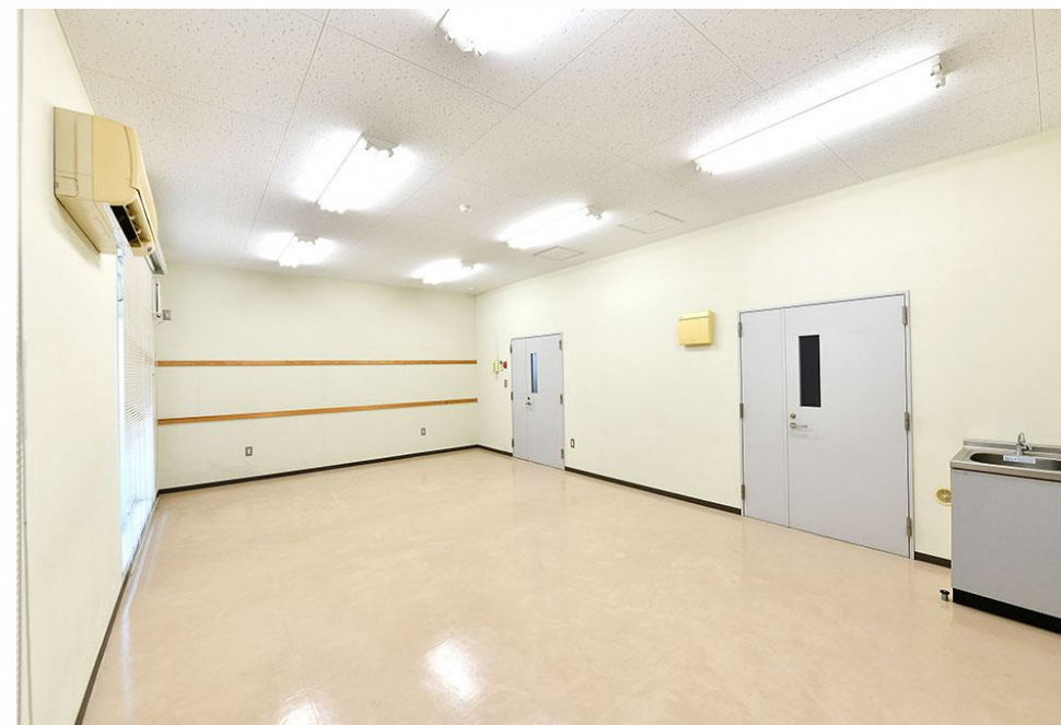
参考：研究室（大）床面積：33.75㎡