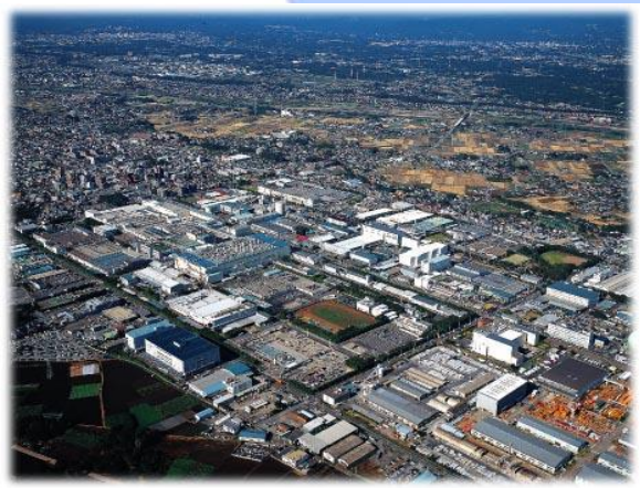
川越・狭山工業団地

当市の面積は48.99km 2 、人口は約148,000人、形はおよそ菱形をなし、市の中央やや北西寄りに入間川が流れ兩岸には河岸段丘が形成されています。中西部には、航空自衛隊入間基地があります。