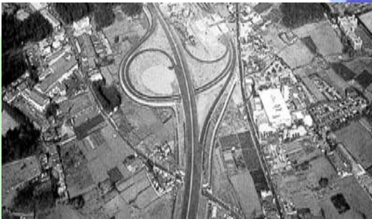
圏央道狭山・日高IC

鉄道網は、西武新宿線と西武池袋線に接続しており、西武新宿駅と池袋駅に約40分から50分でアクセスでき、交通ネットワークが充実しています。