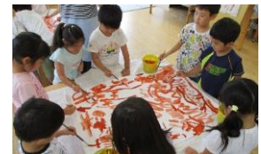
ダイナミックに絵具遊び