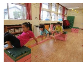
ダイナミックに運動遊び