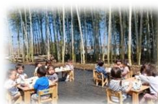
《竹林で青空ランチ》