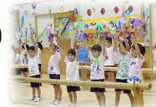
《セタフェスティバル》