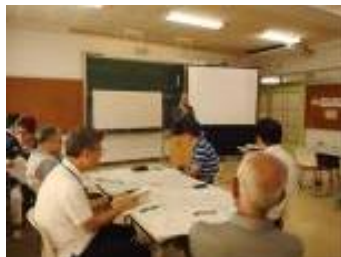
開講式（小山学長挨拶）