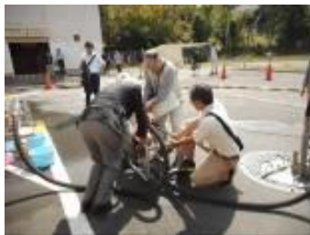
緊急貯水槽からの給水訓練