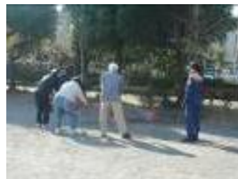
消火器での消火訓練