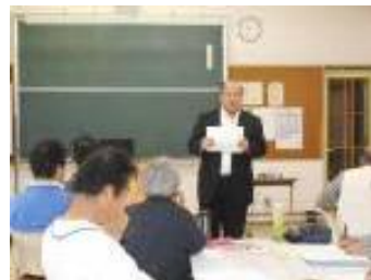
災害対応型状況訓練（岡山講師）