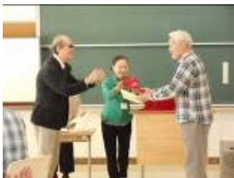
修了証書と赤い帽子の授与