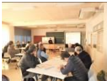
自主防災活動 事例発表