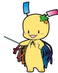
狭山市七夕の妖精 おりびい