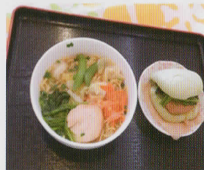
さやま野菜ラーメン ＋野菜パオ 500円