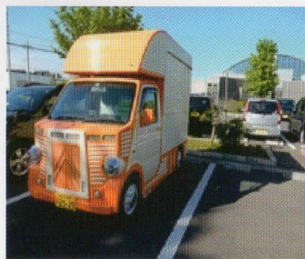
愛車キッチンカー がお供です