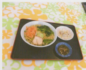
さやま野菜ラーメン (水餃子付) 500円