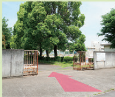
⑤狭山元気プラザ入口を進む