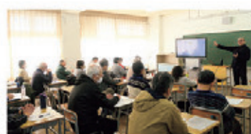
統計って何？ —基礎編—