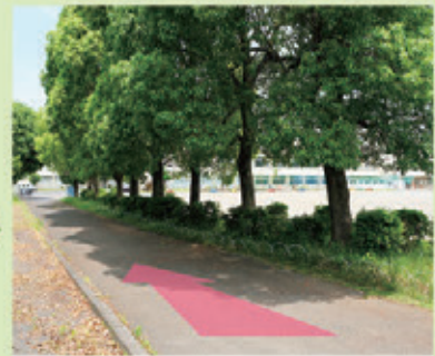
⑥あいさつ小径を進む