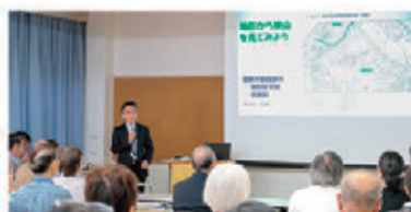
基礎講座：狭山の歴史概要