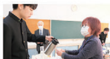
市内の高校生たちの取り組み 「狭紅茶」を学ぼう