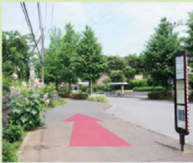
①「狭山台一丁目」のバス停で下車