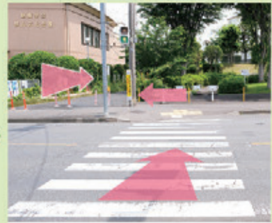
③1つ目の信号の横断歩道を渡る