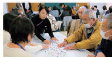
必須講座：ゲームを通して社会を知る(2) ワンダーワールドツアー