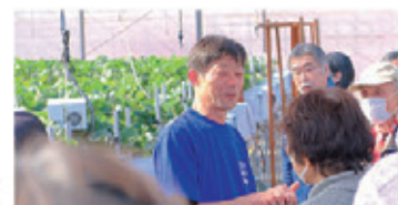
農業を知ろう！ いちご