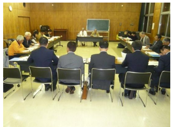
検討協議会の様子（場所：入曽公民館）