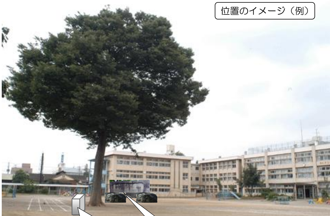
位置のイメージ（例）