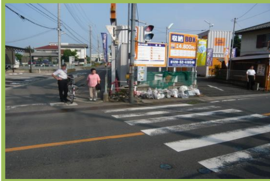
No.101 南小学校通学区域改善箇所⑯ 歩行者用灯器青色点灯時間の延長要望