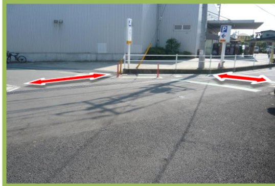
No.77 南小学校通学区域改善箇所④ 横断歩道の設置要望