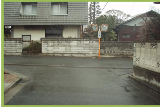
No.105 南小学校通学区域改善箇所⑱ 一時停止標識の設置要望