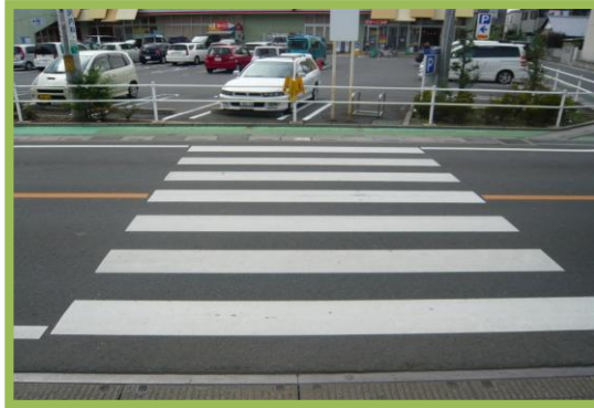
No.106 南小学校通学区域改善箇所⑲ 押ボタン式信号機の設置要望