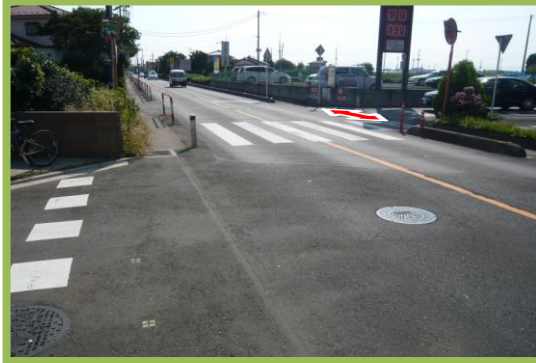
No.98・99 南小学校通学区域改善箇所⑮ 横断歩道及び押ボタン式信号機の設置要望