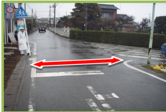
No.83・84 南小学校通学区域改善箇所⑧ 横断歩道及び押ボタン式信号機の設置要望