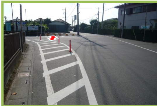
No.81 南小学校通学区域改善箇所⑥ 横断歩道の設置要望