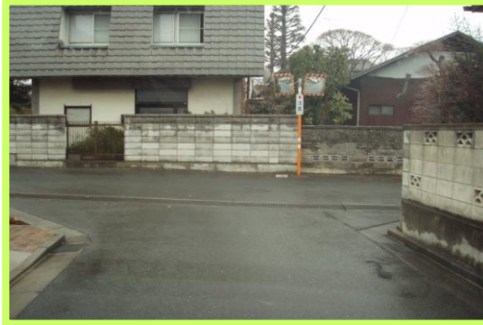
No.105 南小学校通学区域改善箇所⑱ 一時停止標識の設置要望