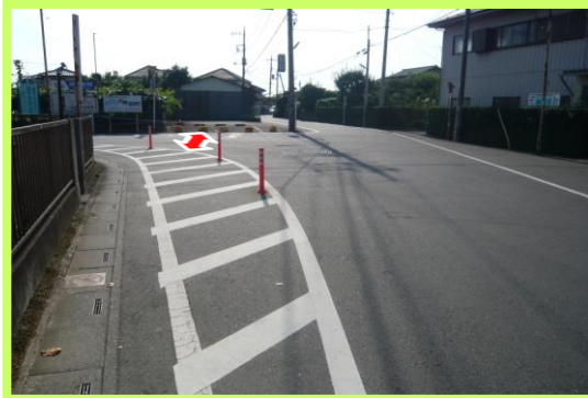
No.81 南小学校通学区域改善箇所⑥ 横断歩道の設置要望