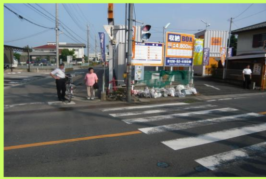
No.101 南小学校通学区域改善箇所⑯ 歩行者用灯器青色点灯時間の延長要望