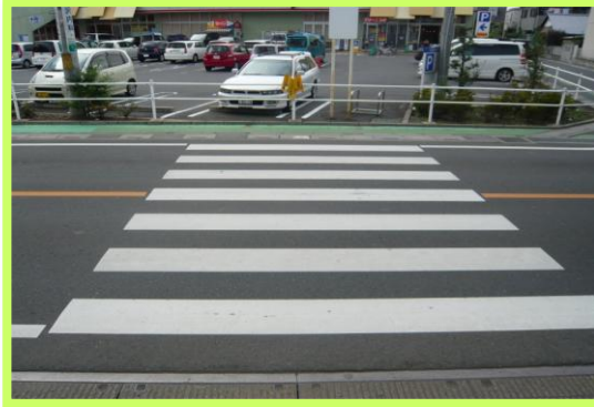
No.106 南小学校通学区域改善箇所⑲ 押ボタン式信号機の設置要望