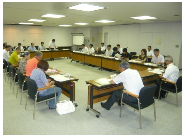
検討協議会の様子(場所:狭山市役所)