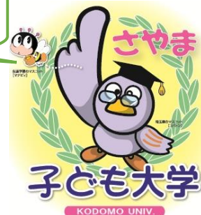
埼玉県マスコットキャラクター コバトン