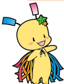
狭山市七夕の妖精 おりぴい

○子ども大学さやまは 武蔵野学院大学のキャンパスなどで、小学校では学ばない、 より専門的なことを、大学の先生などの専門家が、わかりやすく 教えてくれます。