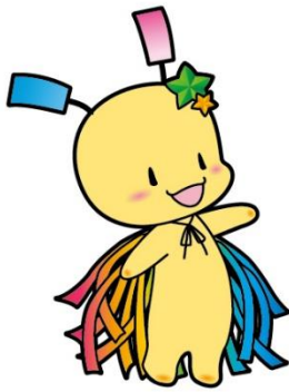
狭山市 七夕の妖精 おりびい