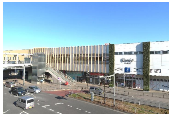
現在の狭山市駅西口