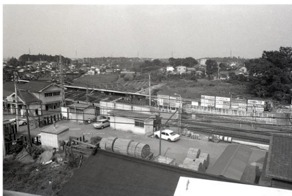
入間川駅西口（昭和49年頃） 〈現狭山市駅〉