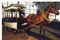
狭山市立博物館に展示されている原寸大レプリカ