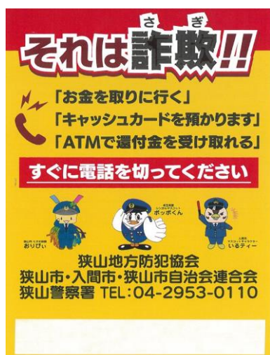
電話機貼付けステッカー