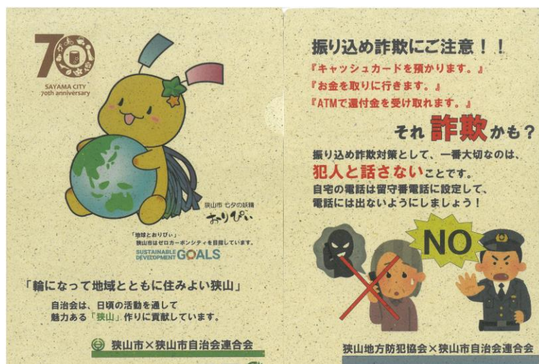
紙製茶殻ファイル（表裏）