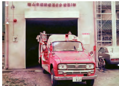
1部車庫昭和50年代の写真