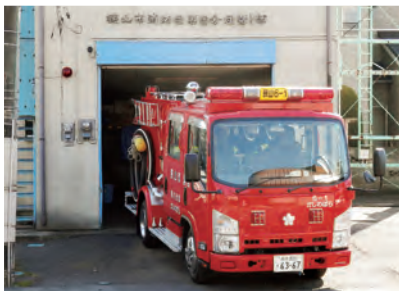
現在の第6分団1部車庫