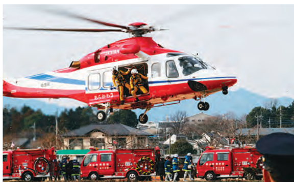
埼玉県防災航空隊による救助訓練