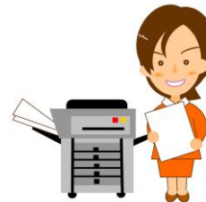
コピー・コンピュータ用紙 シュレッダー類