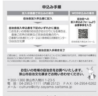
加入促進チラシ裏