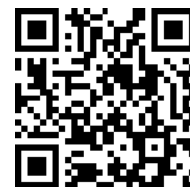
自治会加入申込フォーム

令和4年度より自治会加入申込フォームを作成いたしました。これは必要情報を記入し、送信いただくもので、申込書を記入して連絡することや、直接自治会へ連絡することに比べて負担なく利用できることから、初年度から多数のご利用をいただいています。