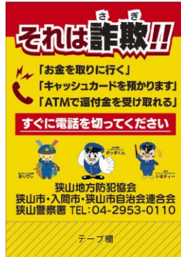
振り込め詐欺啓発ポップ