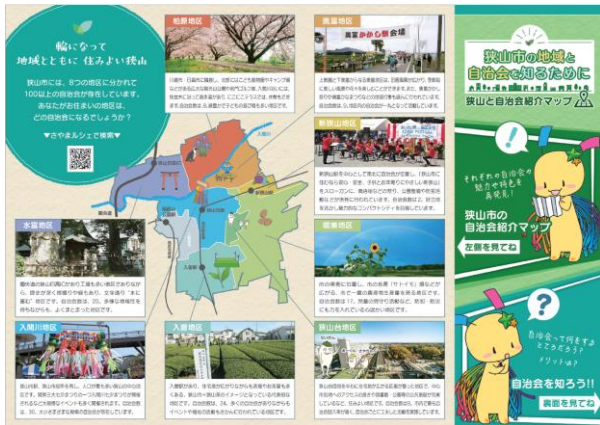
自治会紹介パンフレット表

狭山市の地区と自治会の特徴、自治会で活動することの意義を説明するため自治会紹介パンフレットを作成しています。スマホやPCでの加入申込みフォームやさやマルシェの2次元コードなども記載されています。