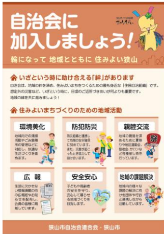
加入促進チラシ表

自治会加入促進に係るチラシを作成しています。チラシには自治会が行う住みよいまちづくりのための地域活動や自治会への加入方法などが明記されています。