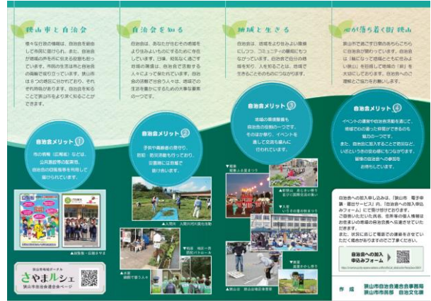
自治会紹介パンフレット裏