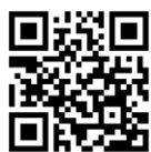
さやマルシェトップ

狭山市地域ポータル「さやマルシェ」は狭山市の地域の様々な情報が掲載されたサイトです。「暮らし ⇒ 狭山市自治会連合会」に狭山市自治会連合会のページがあります。こちらでは、住所から狭山市の自治会が検索できることや、各地区の自治会の紹介（自治会長名など）をしています。自治会によっては自治会報の掲載を行っています。