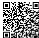
現在自治会に依頼している事項