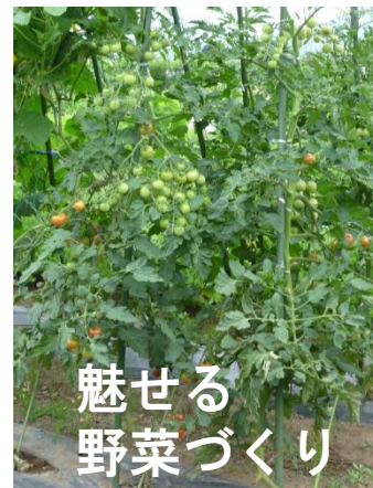
魅せる 野菜づくり