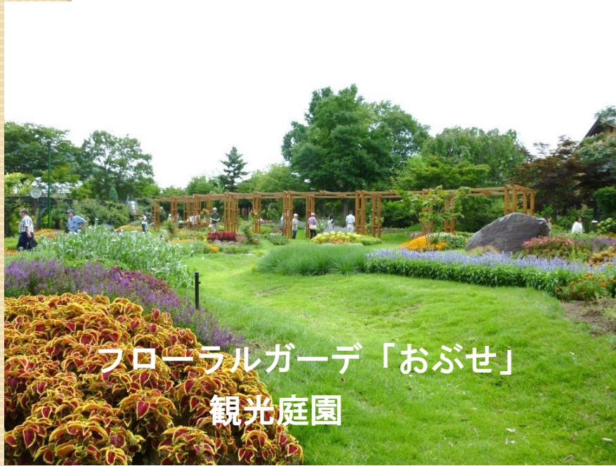
フローラルガーデ「おぶせ」 観光庭園