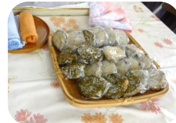
定番おやき 丸ナス使用