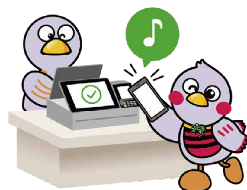
埼玉県マスコット コバトン&さいたまっち