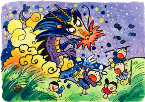
狭山の絵本より「なすとつかえと竜神様」