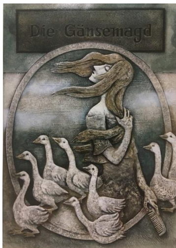
がちょうばんの娘