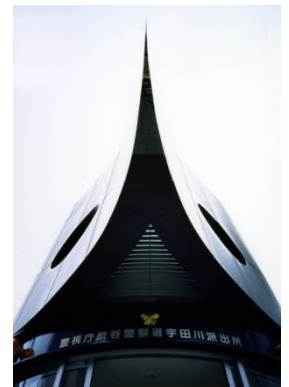
警視庁宇田川派出所