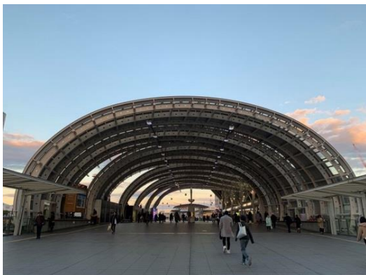
JR東日本 さいたま新都心駅