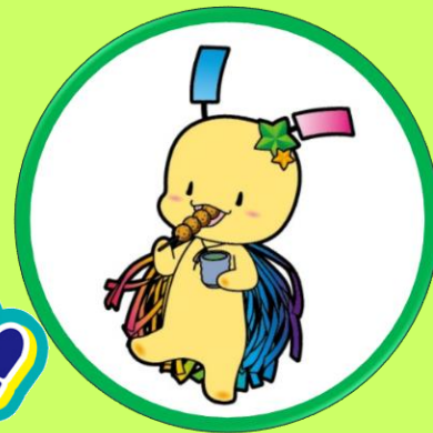
狭山市 七夕の妖精 おりぴい