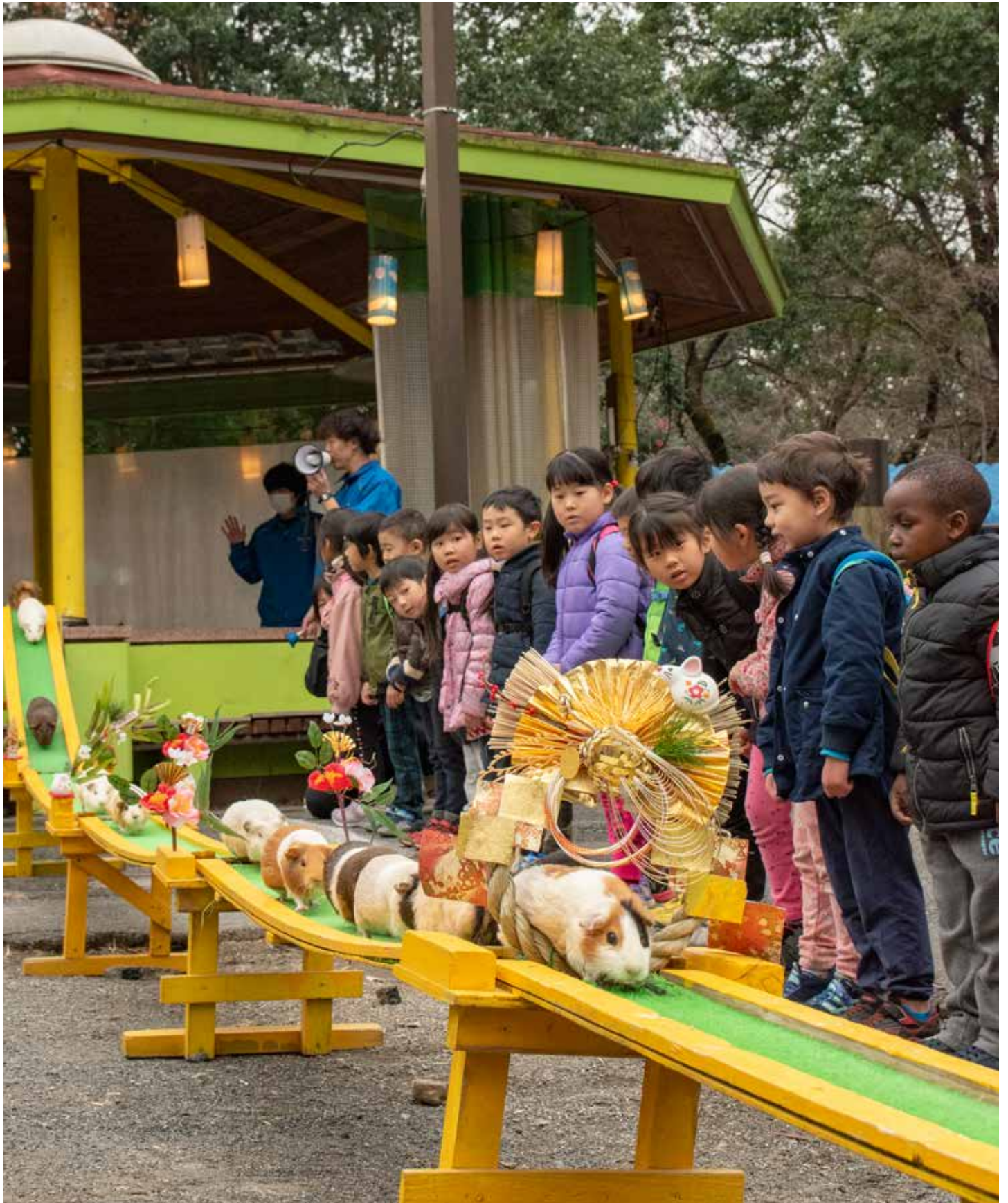
智光山公園こども動物園 テンジクネズミのおかえり橋