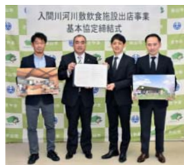
入間川河川敷飲食施設出店事業基本協定締結式

市では、入間川の河川敷を活用し、官民連携により賑わい施設を整備して交流人口の拡大と地域のイメージアップを図る「入間川とことん活用プロジェクト」を進めています。 このたび、飲食店の募集を行った結果、「スターバックスコーヒージャパン株式会社」を事業者として決定し、12月25日(水)に基本協定を締結しました。 店舗は2年度中のオープンを目指しており、市が実施する大型遊具などの整備と合わせ、入間川に新しい魅力的なスポットが誕生します。 問合せ 商業観光課へ内線2551