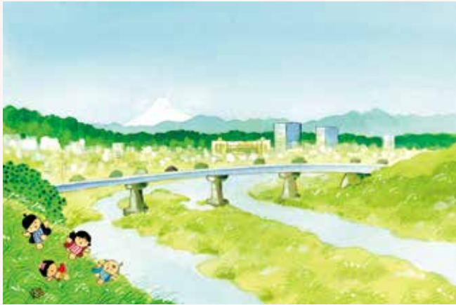
題字・童絵・文/池原昭治氏