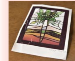
絵葉書の表面には、たくさんの思い出が書かれています

たことです。その道のりは想像以上に険しく、結果的に4泊5日の長旅となりました。中でもよく覚えているのが、喉を潤すため、山中の川の水を飲み、その水にあたってしまったこと。友人は身動きが取れなくなった私を担いで急斜面を上がり、ご飯を炊いて食べさせてくれました。あの時友人がいなければ、助からなかったかもしれない。悪い思い出ばかりではなく、瑞牆山で見たヒカリゴケや、標高2