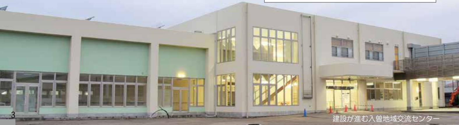
建設が進む入曽地域交流センター