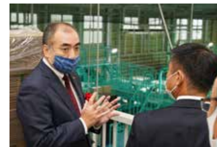
さとも選果施設を視察