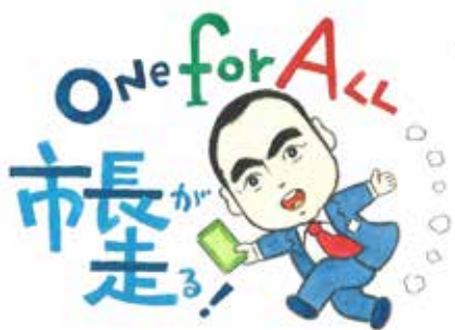
題字・絵 池原 昭治氏