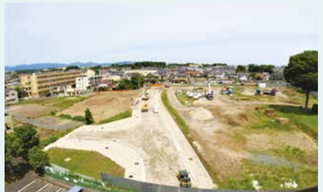
現在のようす(令和4年5月)