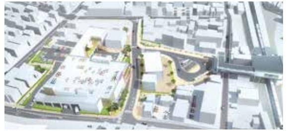
まちびらき後の入曽駅周辺イメージ