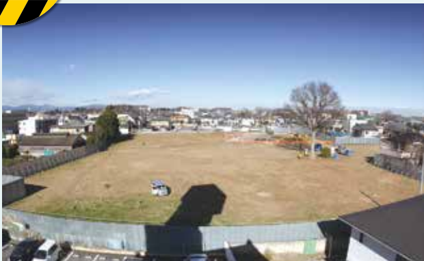
工事施工前のようす(令和3年1月)