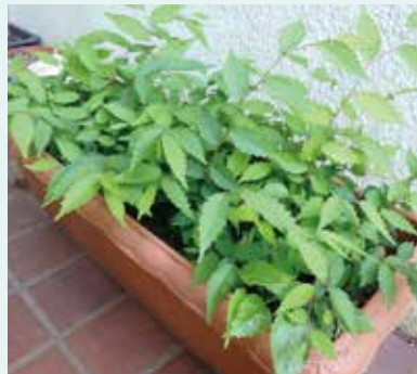
後継木の育成状況(令和4年6月)

入間小学校跡地には旧入間小学校のシンボルであるケヤキがあります。商業施設出店を希望する企業や樹木の専門家に相談し、このケヤキの伐採、伐根を決定しました。現在はケヤキの後継木の育成を行っており、形を変えても入曽地区を見守る存在であり続けられるように、希望者への配布や周辺の公共施設などへの植樹を検討しています。